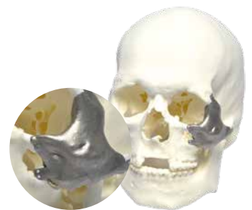
Fertigung eines Jochbein-Implantats