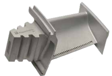
Mit Selective Laser Melting (SLM) gefertigte Turbinenschaufel

Gerne prüfen wir gemeinsam mit Ihnen den Einsatz von 3D-Scanning und Reverse Engineering-Technologien in Ihrem Unternehmen. Wir freuen uns auf Ihre Anfrage.