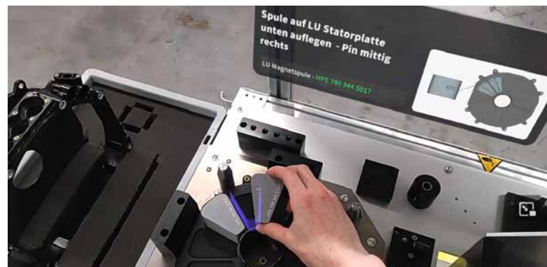
Abb. 3: Kontext Platzieren