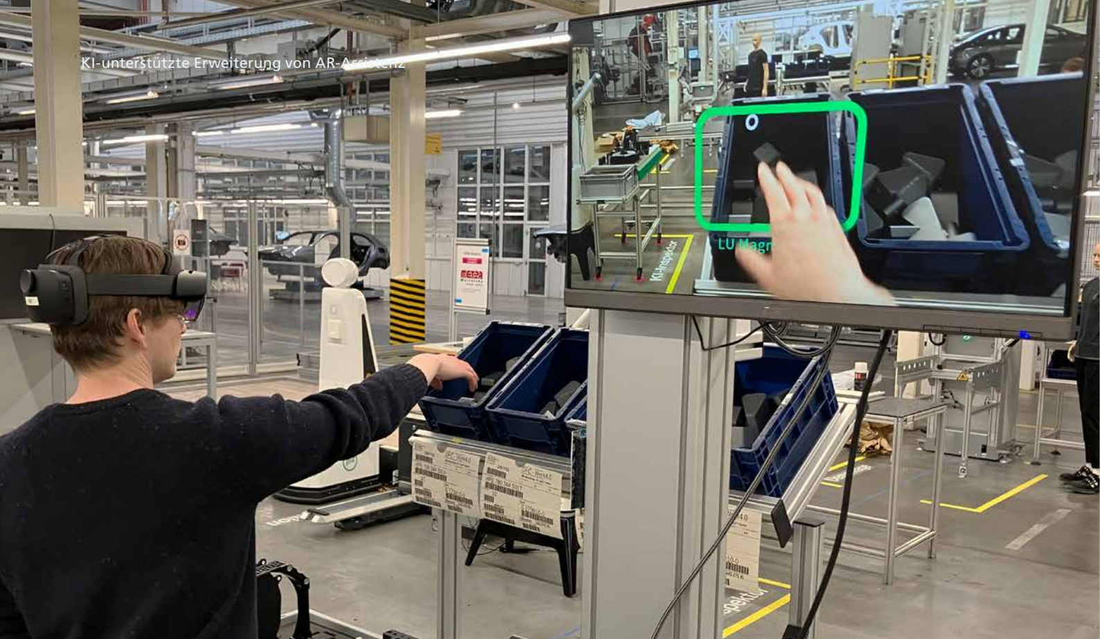
Abb. 1: Adaptive AR-Montageassistentz – Werk 4.0, Fraunhofer IPK