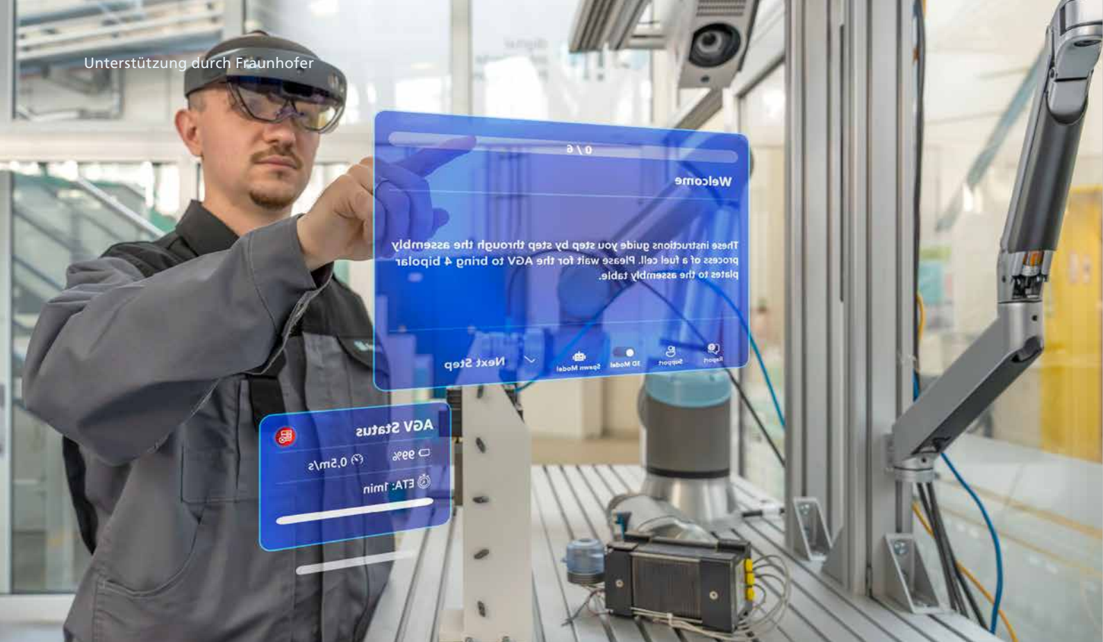
Adaptive AR-Montageassistentz – Fraunhofer IPK, Leistungszentrum Digitale Vernetzung