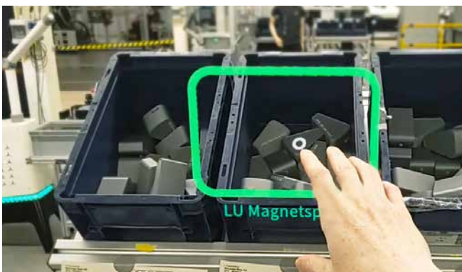
Abb. 2: Kontext Greifen

Durch diese situationsbasierte Adaptivität wird die AR-Assistenz nicht zum starren Hilfsmittel, sondern zum intelligenten Partner, der Fehler vorbeugt und die Prozesssicherheit steigert. Das Projekt zeigt damit einen konkreten Weg, wie Industrie-4.0-Technologien in der täglichen Fertigung wirksam umgesetzt werden können.